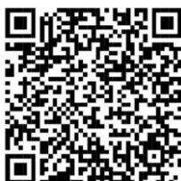
Domácí násilí na seniirech a možnosti jeho řešení