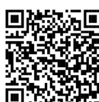
Pomoc v případě akutní krize při duševním onemocnění