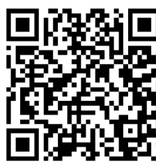
QR kód pro iOS