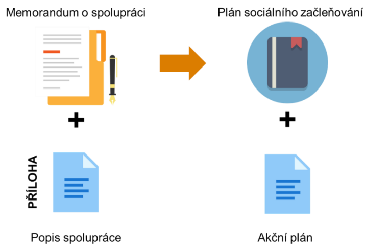
Obrázek 1 Schéma spolupráce

Tento Akční plán je nedílnou součástí dlouhodobé koncepce s názvem Plán sociálního začleňování Ostrava 2022–2027 , která si klade za cíl zlepšit situaci na poli sociálního začleňování ve městě Ostrava a kterou vytvořilo statutární město Ostrava ve spolupráci s Odborem (Agenturou) pro sociální začleňování Ministerstva pro místní rozvoj ČR. Podoba dokumentu vyplývá z uzavřené spolupráce mezi oběma subjekty, která je stvrzena memorandem o spolupráci a blíže popsána v takzvaném popisu spolupráce.